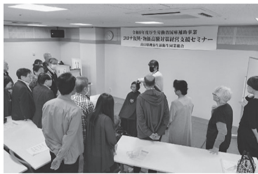
岩国支部 衛生講習会

令和6年10月28日(月)午前9時30分より、岩国市民文化会館第1研修室に於いて、共済説明会、技術講習、衛生講習会を3部に分けて出席者26名で開催されました。