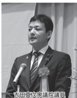
吉田真次衆議院議員