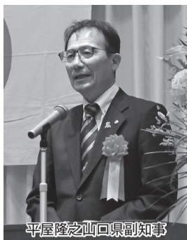
平屋隆之山口県副知事

令和6年11月18日(月)午後1時 かめ福オンプレイス(山口市) に於いて連合会設立50周年記念 第33回山口県生衛業振興大会が、 参加者約130名で盛大に開催 されました。