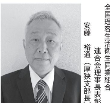
全国理容生活衛生同業組合 連合会理事長表彰

この度は、全国理容生活衛生 同業組合連合会理事長表彰をい ただき、有り難く思います。 これからも理容業の発展に貢 献できるよう努めていきたいと 思います。